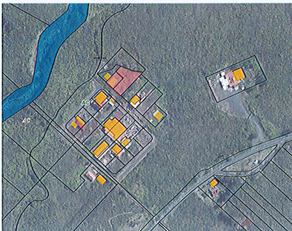
Plan de localisation des terrains AC 537 et 538

En date du 9 juillet 2018 et afin de pouvoir mieux développer son activité, Mr BENARD a sollicité la Commune pour l'achat de la parcelle AC 537 mais aussi de celle mitoyenne, la parcelle AC 538 pour une surface de 1318 m 2 .